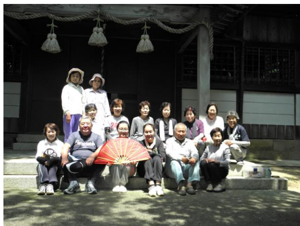
瀬戸支部のみなさん 大元神社境内