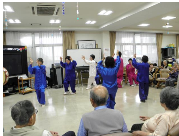
最後は阿波踊りを披露させていただきました。