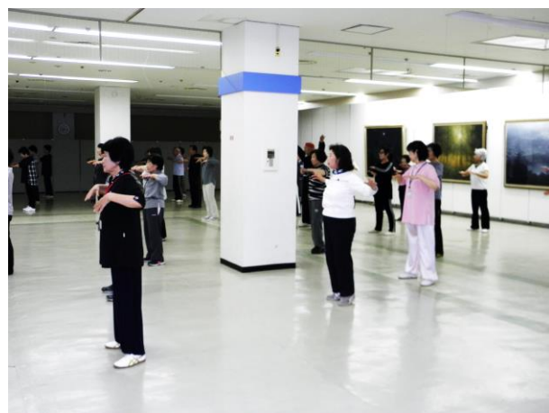
準備体操をしました。