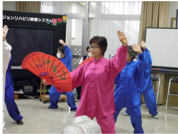
続いて中国大極功夫扇を披露