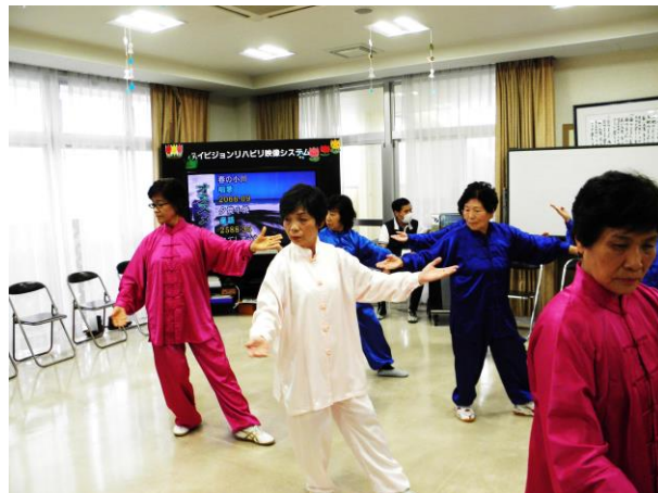
最初に簡化24式太極拳を披露させて頂きました。