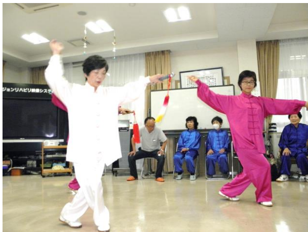
次に32式太極剣を披露