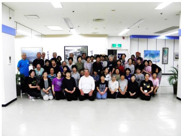
撫養支部のみなさん キョーエイ鳴門駅前店 4F ホール

発行日 2016年7月11日 発行者 太極拳を楽しむ「パンダの会」 事務局 鳴門市大津町木津野字内田 7-10 コミュニティはうすTSUDO I内 TEL & FAX (088) 685-6177