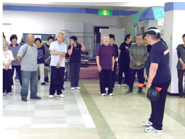
始める前に指導者の方からあいさつがありました。