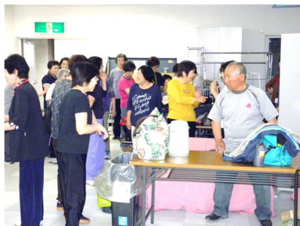
休憩時間には、知り合いの人と会話がはずみます。