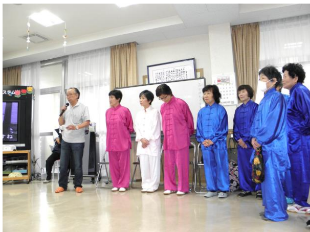
施設訪問で挨拶をさせて頂きました。

訪問先 そよがぜ 平成 28 年 6 月 7 日 (火) 午後 2 時～3 時 参加者 9 名