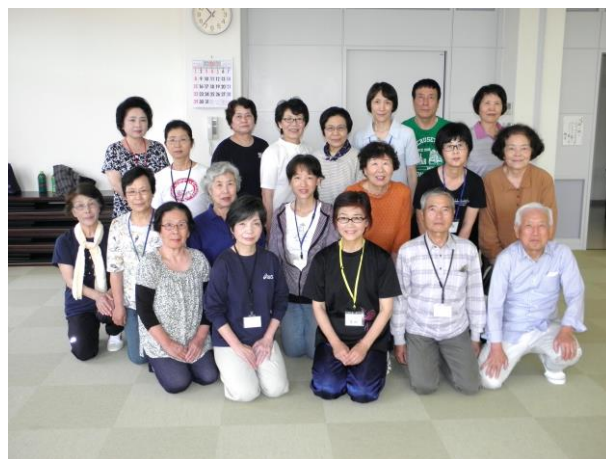
板東支部のみなさん 板東公民館