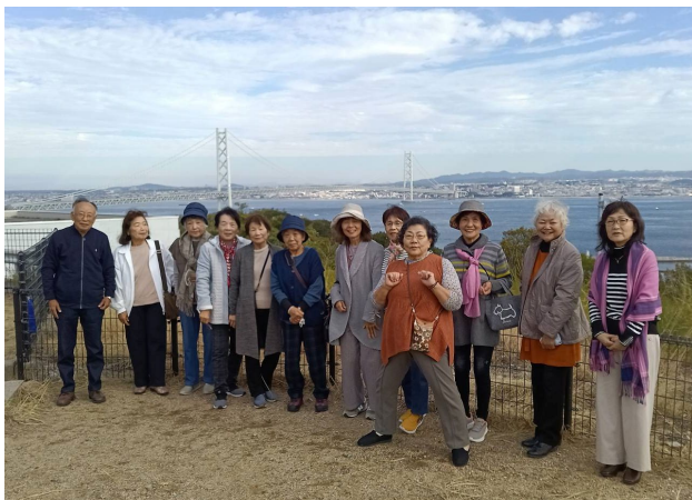
淡路島サービスエリアでの集合写真