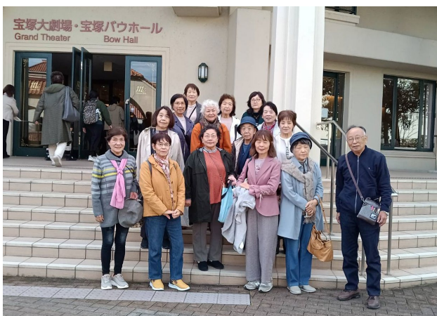
宝塚大劇場・宝塚バウホール前にて