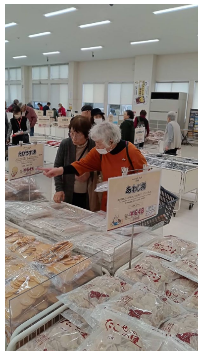
淡路島たこせんべいの里おみやげ売場にて