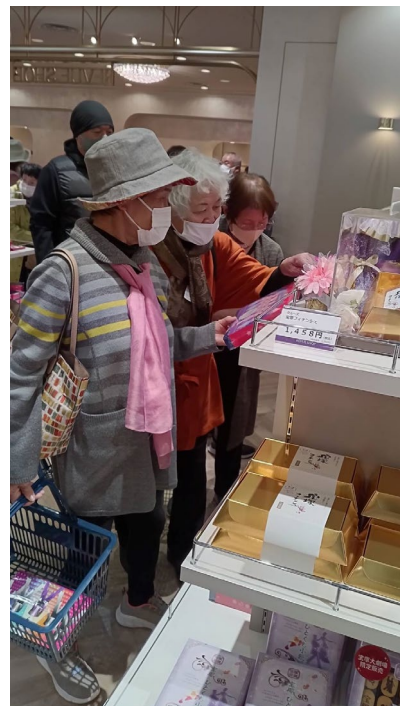
宝塚バウホールおみやげ売場にて