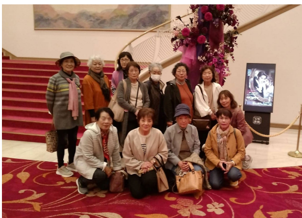
宝塚バウホール内にて