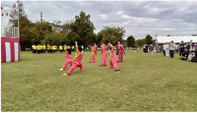
徳島武術太極拳チーム