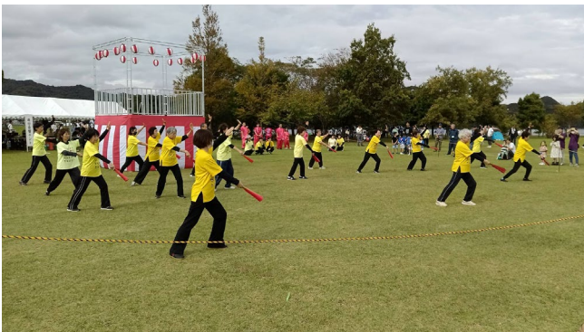
太極拳を楽しむ「パンダの会」